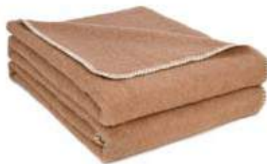
Chamois / Feston blanc