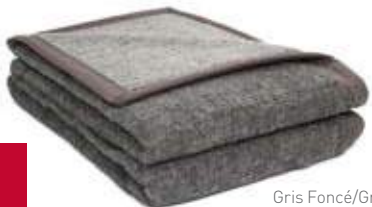
Gris Foncé/Gris Clair