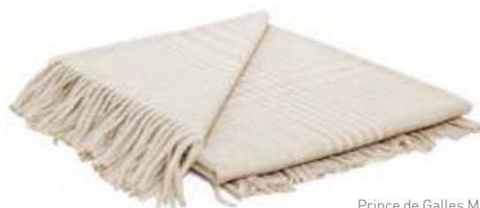
Prince de Galles Miel Blanc