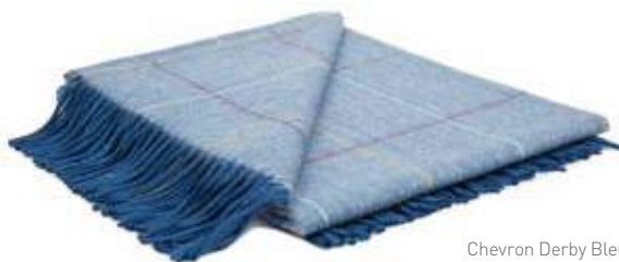
Chevron Derby Bleu Nuit