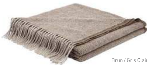
Brun / Gris Clair