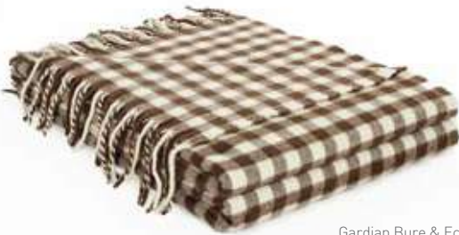
Gardian Bure & Ecume