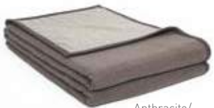
Anthracite/ Gris Moyen