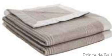
Prince de Galles