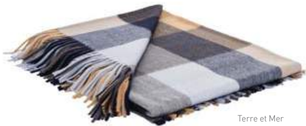
Terre et Mer