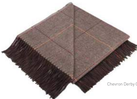
Chevron Derby Cuivre