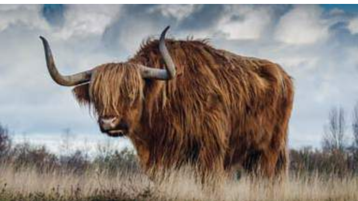
Yack de l'Himalaya : un poil très doux, aux tons naturels gris, crème ou marron foncé, pour des plaids et des écharpes.