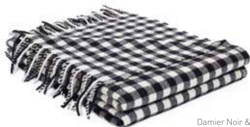
Damier Noir & Blanc