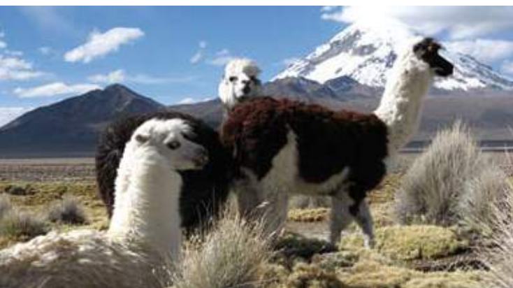
Alpaca, bébé Alpaca et bébé Lama des Andes : au poil long et doux, à la palette exceptionnelle de tons naturels. L'Alpaca provient essentiellement du Pérou, le bébé Lama de Bolivie.