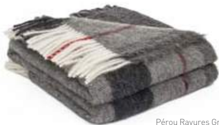
Pérou Rayures Gris & Filet Rouge