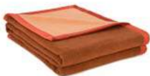
Tuile/Terre de Sienne