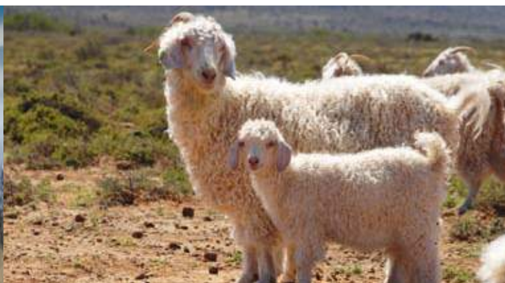
Cashgora : un très rare hybride aussi brillant et blanc que le mohair et aussi doux que le cachemire.