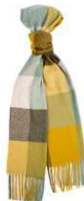
Terre et Jardin