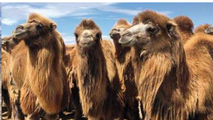
Chameau et bébé chameau : sous un poil extérieur très épais et rude, le chameau offre un duvet très fin, à la fois très doux, très chaud et résistant. Brun de Vian-Tiran collabore avec des ONG en Mongolie pour un développement durable, éco-responsable et éthique.