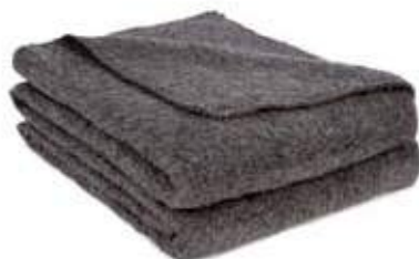
Gris Foncé / Feston noir