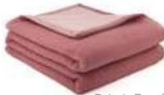
Bois de Rose/Rose