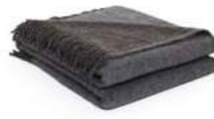
Bleu Gris/Gris Foncé