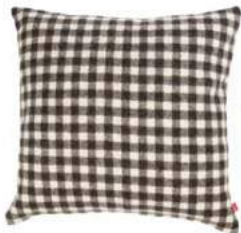
Gardian Marron 50 x 50 cm