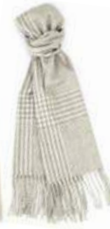
Prince de Galles