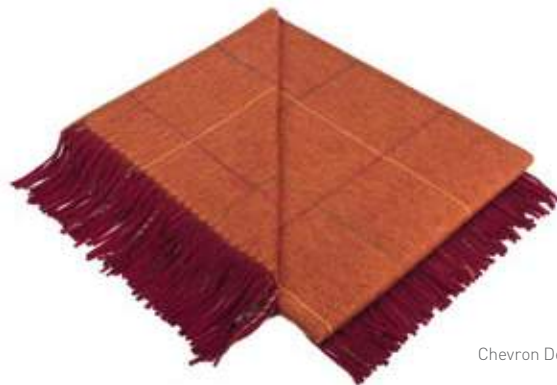
Chevron Derby Corail