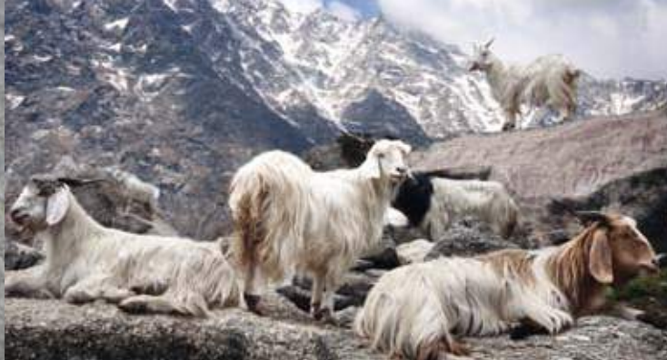
Chèvre cachemire : le sous-poil de la chèvre cachemire est connu pour sa finesse et son toucher caractéristique, dit "savonneux". Brun de Vian-Tiran distingue différentes qualités de cachemire selon leurs origines, pour les destiner à des couvertures ou couettes chaudes, des plaids raffinés, des châles légers...