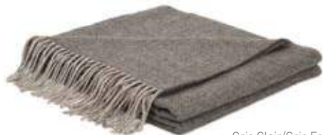
Gris Clair/Gris Foncé