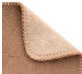
Finition alternative : Feston chamois clair.