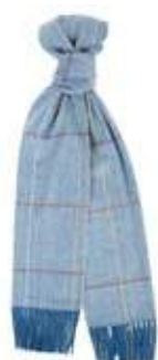
Derby Bleu Nuit