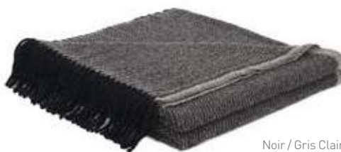
Noir / Gris Clair