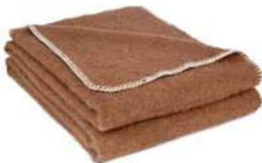
Café / Feston blanc