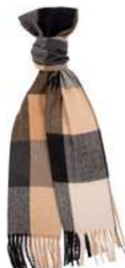
Terre et Volcan