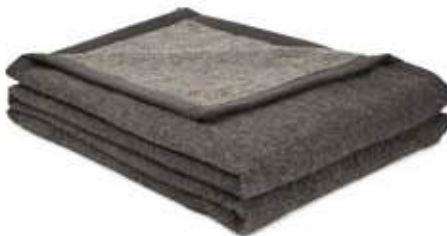
Gris Foncé/Gris Clair