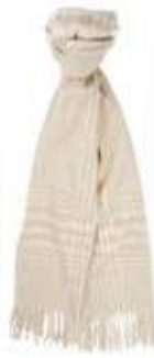
Prince de Galles Miel