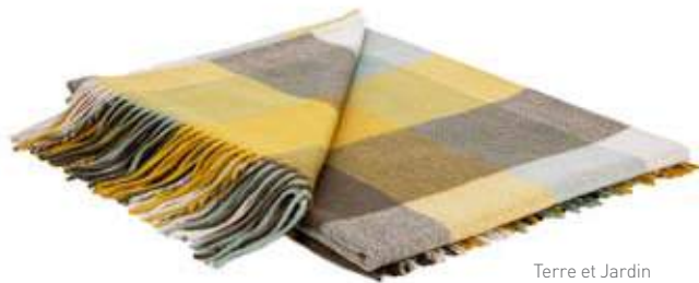
Terre et Jardin