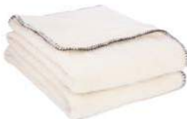
Crème / Feston noir