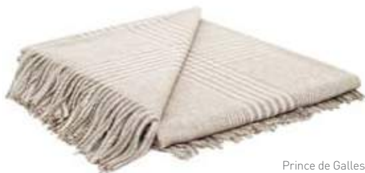
Prince de Galles