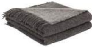
Gris Clair/Gris Foncé