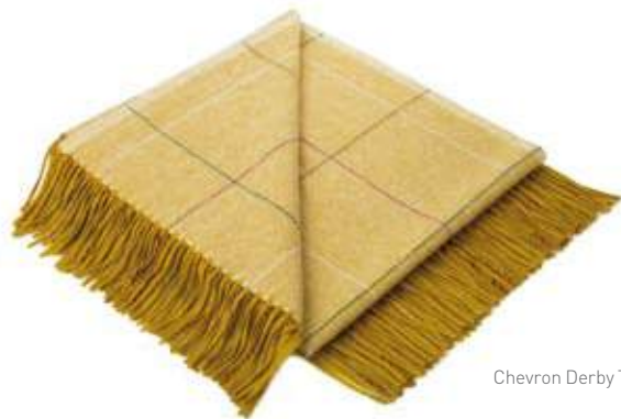
Chevron Derby Topaze