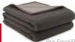
Gris Foncé/Gris Clair