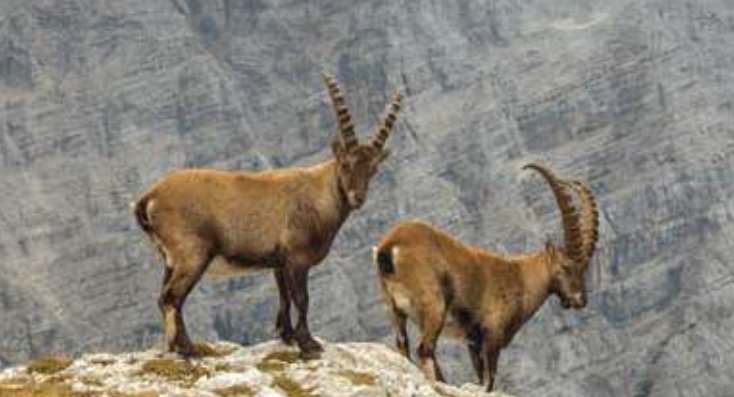
Yangir , l'ibex ou bouquetin de l'Himalaya : finesse incomparable, élégant gris naturel, toucher exceptionnel et inoubliable.