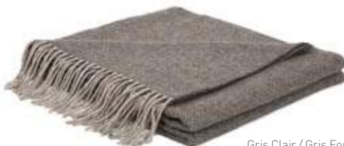
Gris Clair / Gris Foncé