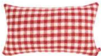
Gardian Rouge 30 x 50 cm