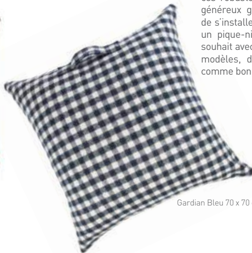
Gardian Bleu 70 x 70 cm