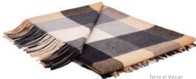
Terre et Volcan