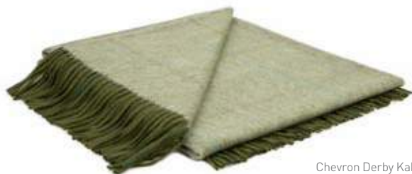
Chevron Derby Kaki