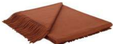
Terre de Sienne